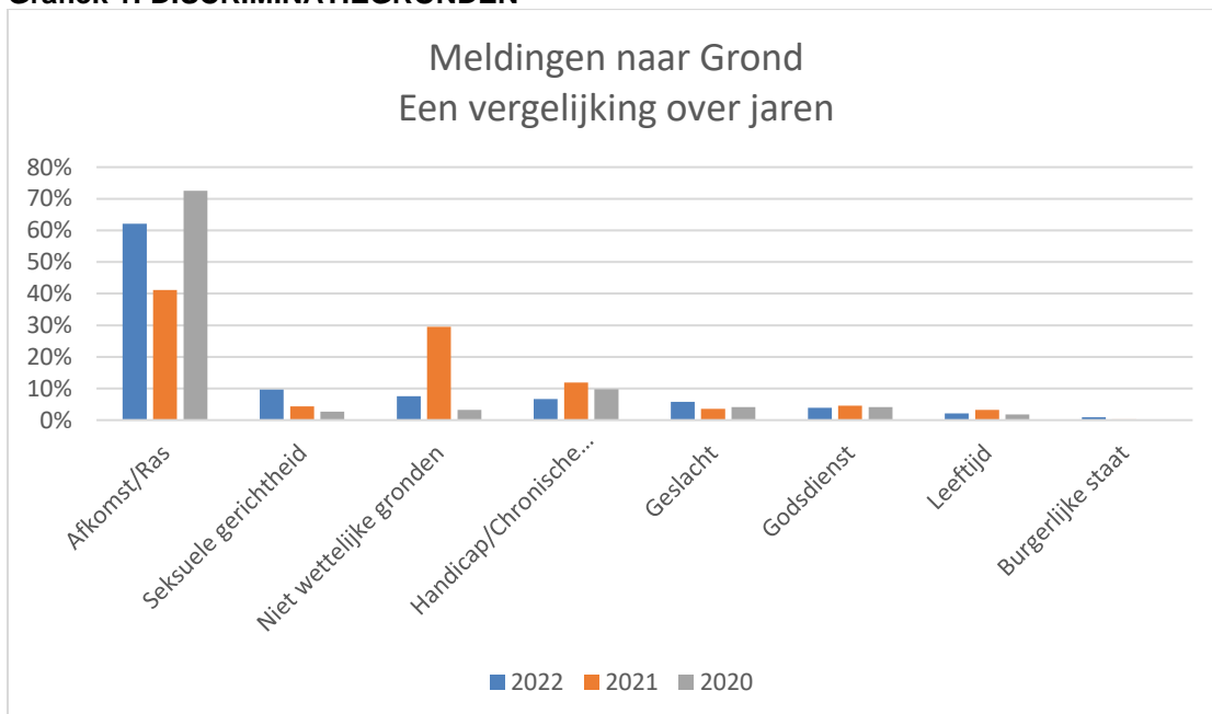
Grafiek 1: DISCRIMINATIEGRONDEN 2

***omdat er bij sommige meldingen meer dan één grond wordt geregistreerd, is het totaal aantal gronden groter dan het totaal aantal meldingen.